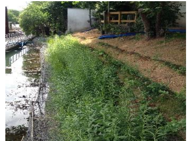
Avant/Après travaux de restauration des berges de l'île Saint-Germain à Issy-les-Moulineaux