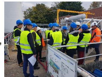
Classes d'eau de 2017 sur l'eau potable

Enjeu D : Sensibilisation, éducation à l'environnement, suivi et coordination des actions.