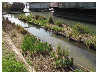
Frayère à Boulogne-Billancourt

Enjeu C : Restaurer le milieu naturel et poursuivre la mise en œuvre d'une Trame verte et bleue régional en adéquation avec le SRCE.