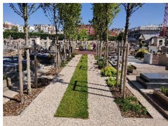
Cimetière de Vanves

Enjeu A : Gérer à la source les eaux pluviales et lutter contre les îlots de chaleur en concourant à la mise en œuvre du Plan Vert d'Île-de-France.