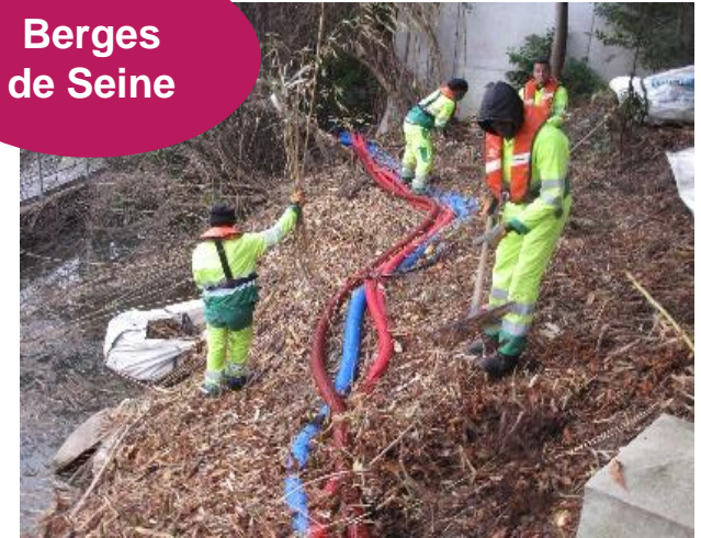
Berges de Seine