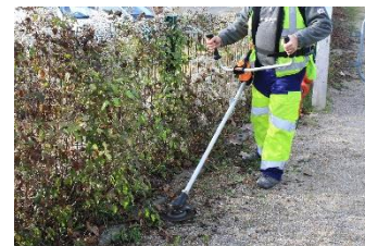
Entretien mécanique (fauchage)

Enjeu B : Améliorer la performance de gestion des eaux usées, économiser et protéger la ressource.