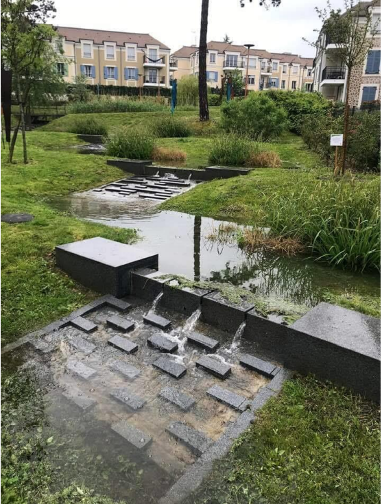
Jardin des eaux à Fourqueux